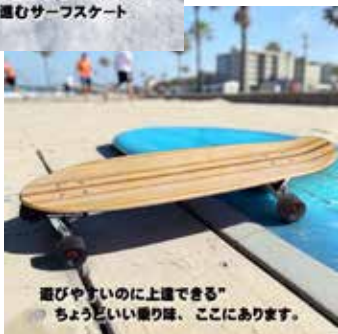
遊びやすいのに上達できる”ちょうどいい乗り味、ここにあります。