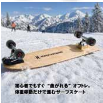
初心者でもすぐ“曲がれる”オフトレ。体重移動だけで進むサーフスケート